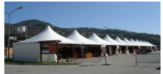
"I Mercanti del Mediterraneo"

La Marina Mediterranea si arricchisce di eventi come sfilate di Moda, degustazione piatti tipici, prodotti dell'agro alimentare, Vini e liquori di preziose selezioni proposte dagli espositori.